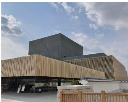
高槻城公園芸術文化劇場 Takatsuki Arts Theatre